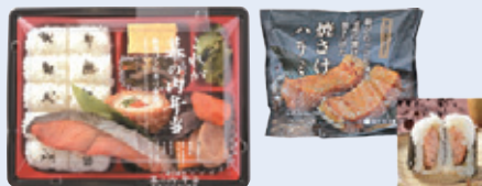
注)掲載商品は一例です。季節により内容が変更になる場合があります。

2017年は、のり弁当や幕の内弁当など定番中の定番に絞り込んだ「これが」シリーズの発売を開始。おにぎりも素材や製法にこだわって「ローソンといえばおにぎり」を追求するなど、商品力のアップを図りました。