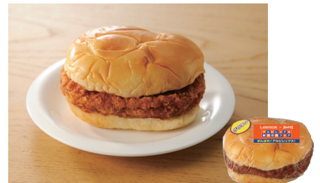
グラタンコロケバーガー 120円(税込)