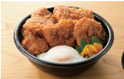
半熟とろ〜り玉子のタレかつ丼 598円(税込)