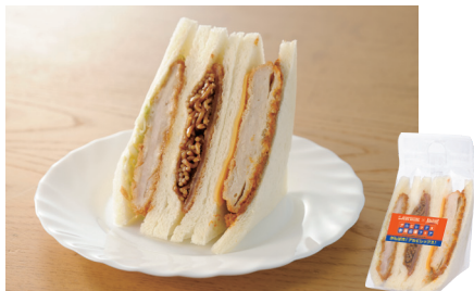
トリプルカツサンド 330円(税込)

※各店先着500個、からあげクンはレギュラーのみ対象(レッド・チーズ等は対象外)となります。イベントでの販売も予定しています。