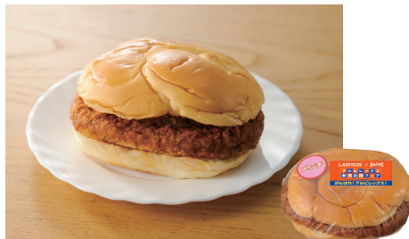
メンチカツバーガー 120円(税込)