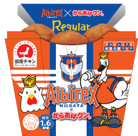
からあげクン レギュラー 216円(税込)

※各店先着500個、からあげクンはレギュラーのみ対象(レッド・チーズ等は対象外)となります。イベントでの販売も予定しています。